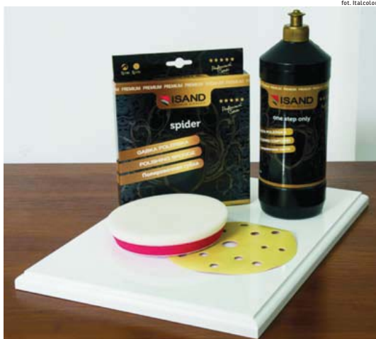
ONE STEP ONLY to kompletny system do polerowania.

Wstępne przygotowanie powierzchni (także