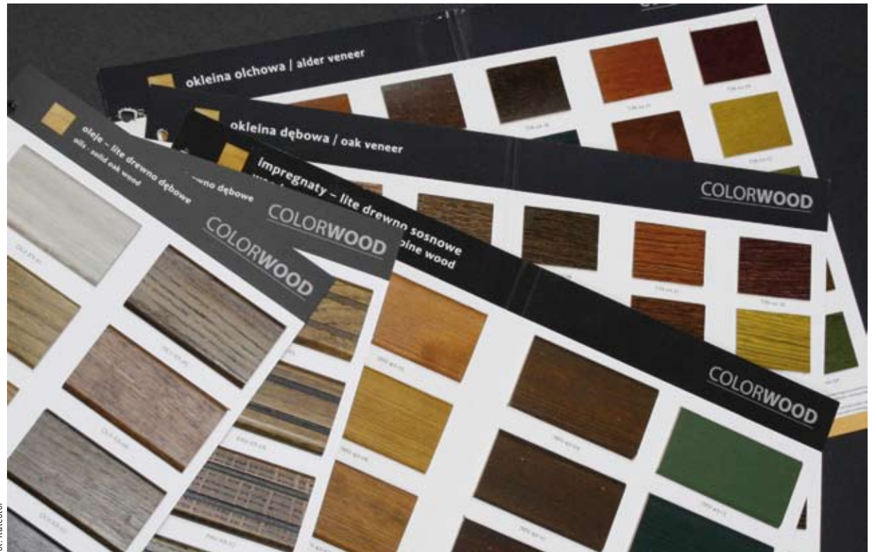
Pełną gamę produktów COLORWOOD zawarto we wzorniku „galeria kolorów drewna”.